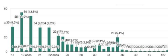
Gráfico 1. Edad de los pacientes

La totalidad de los participantes ( n = 426 ; 100 %) declaró tener entre 18 y 35 años y aceptó participar de manera voluntaria en el estudio. Siendo la mayor concentración de participantes en las edades más tempranas del rango, destacándose los 19 años con la mayor frecuencia (50 participantes; 13,6 %), seguidos por los 20 años (55 participantes; 14,9 %) y los 18 años (35 participantes; 9,5 %). A partir de los 21 y 22 años, la frecuencia comienza a descender de forma progresiva, manteniéndose una distribución relativamente dispersa en las edades posteriores.